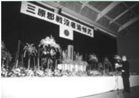
▶ 式辞を述べる町長

会場には、各町長をはじめ約八百名の遺族の方々が集まりました。一人ひとりが恒久平和を祈るとともに、悲惨な戦争を二度と繰り返さないことを誓いました。