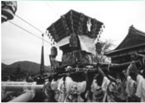
▶ 力を合わせて持ち上がっただんじり（安住寺）

きらびやかな「だんじり」の太鼓が朝から響き、各地区で祭礼団による獅子舞やだんじり唄が披露されました。