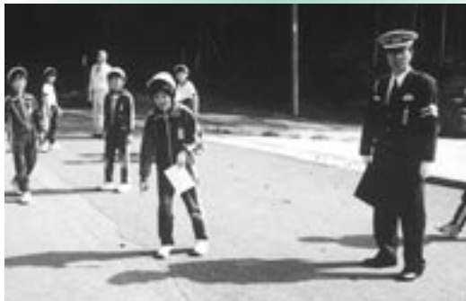
▶ 白線消えているよ

四月十三日、倭文小学校の六年生十九名が自分たちの通学路を点検しました。この点検は、新学期を迎えたことと、春の交通安全運動に併せて、三原警察署員らの協力で実現したもので、参加した児童らは二班に分かれてそれぞれ約一キロの道のりを歩いて点検。白線が消えている所や歩道の狭い所など、児童の目線で危険な箇所をリストアップしました。これを受けて今後直していく予定です。