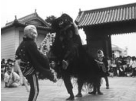
▶ 熱が入る獅子ともすけ