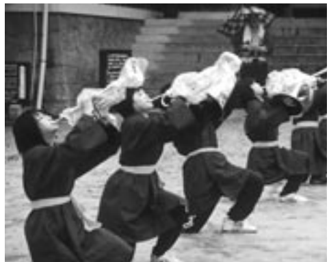
▶ 雨の中ががんばった吹奏楽部の皆さん