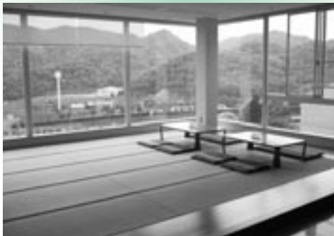
▶ 湯上がりには、お立ち寄りを